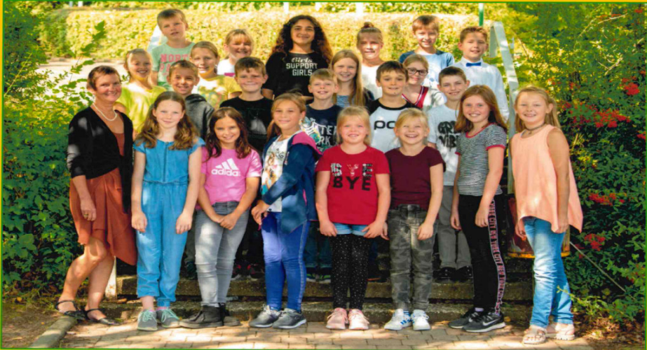
Meine Klasse Elbetalschule 2019