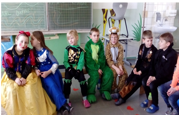
oben: kleine Narren aus der 2a

Allen Aktiven auch an dieser Stelle nochmals ganz herzlichen Dank für den tollen Einsatz!