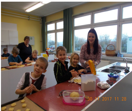
Die Klasse 1a und

Auch unsere ersten Klassen sind fleißig mit dabei