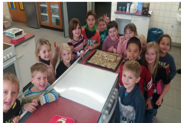
die Klasse 1b

Mit großer Vorfreude konnten die Kinder der Klasse 1b am 08.12.17 endlich in der Schulküche Plätzchen backen.