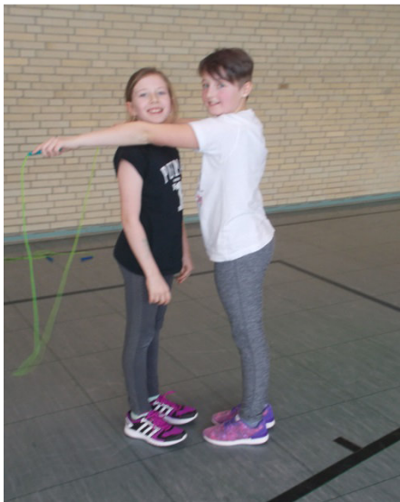
Spiel und Spaß auf dem Sensenstein

Alle Jahre wieder fahren unsere vierten Klassen für eine Woche auf den Sensenstein , um sich dort auf die Fahrradprüfung vorzubereiten. Auch wenn es Ende Oktober draußen nicht mehr so schön zum Spielen und Toben war, war die Stimmung trotzdem gut und die gemeinsam verbrachte Zeit im letzten Grundschuljahr bleibt sicher auch später noch bei allen in lebendiger Erinnerung.