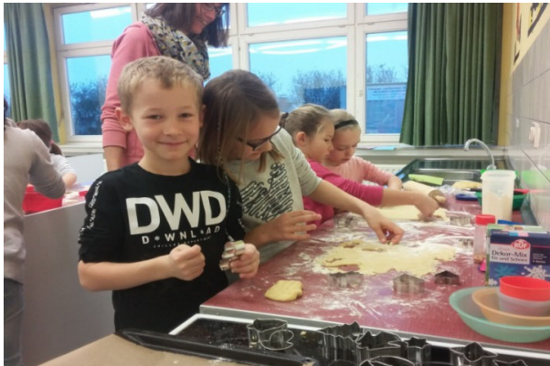
In der Weihnachtsbäckerei der Klasse 2b

Alle Klassen haben mitgemacht und Plätzchen gebacken, die auf dem Weihnachtsmarkt in Naumburg am ersten Adventswochenende verkauft werden konnten. Der Förderverein hat es möglich gemacht und in seinem Stand nicht nur die schulhausgemachten Plätzchen verkauft, sondern auch fleißig Crêpes gebacken und angeboten. Ein herzliches Dankeschön für diese tolle Aktion!